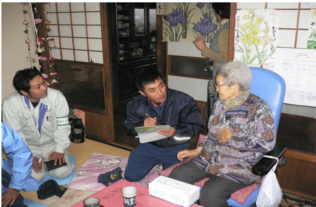
一人暮らし住宅防火診断