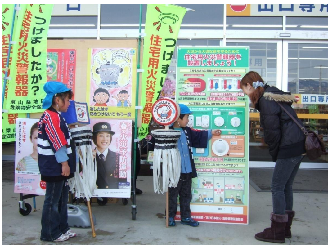
住宅用火災警報器設置推進街頭広報