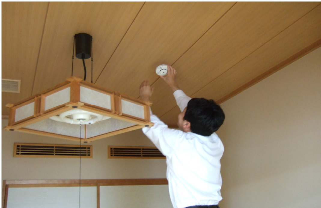
住宅用火災警報器の設置状況