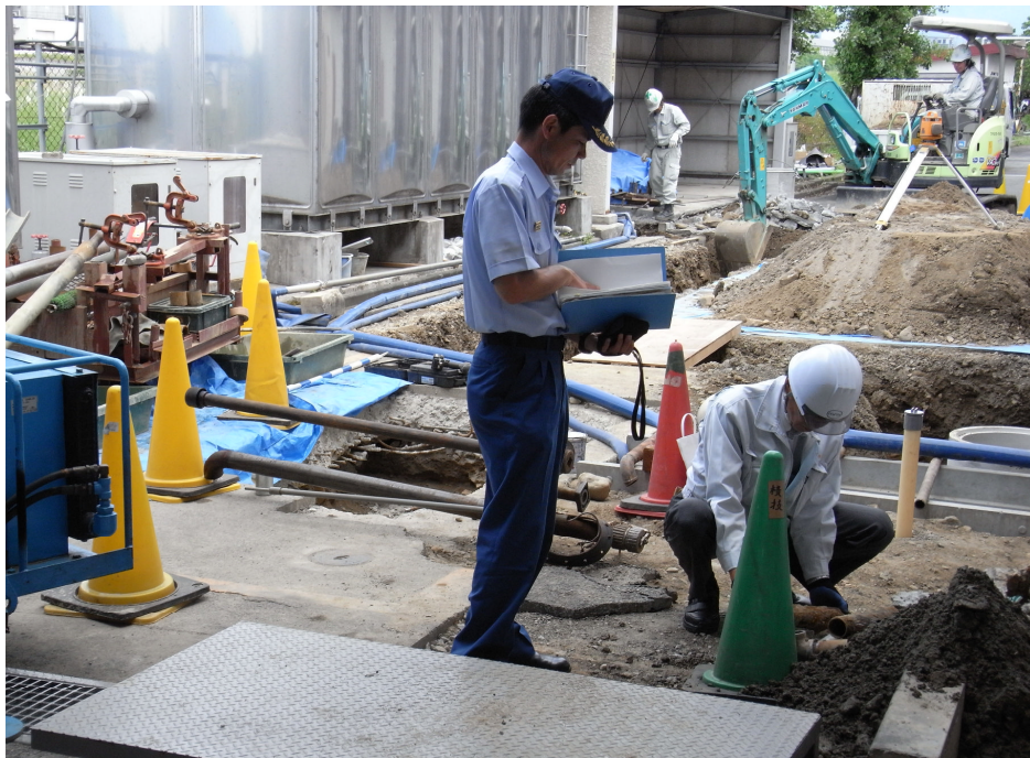
危険物地下タンク貯蔵所の埋設配管取替え工事の立入検査