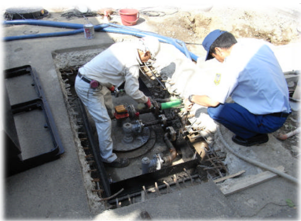
危険物地下タンク貯蔵所の埋設配管取替え工事の立入検査