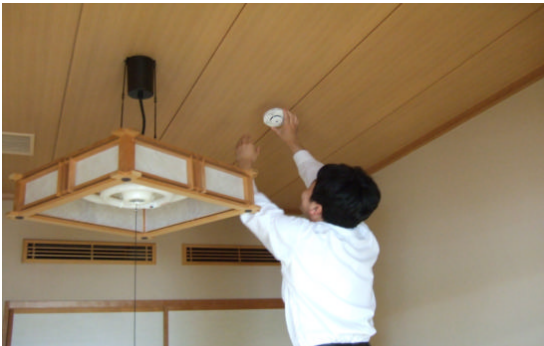
住宅用火災警報器の設置状況