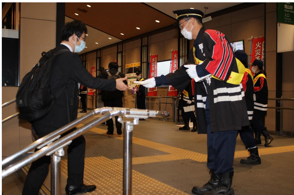
J R塩山駅の自由通路において、消防団との街頭広報による火災予防