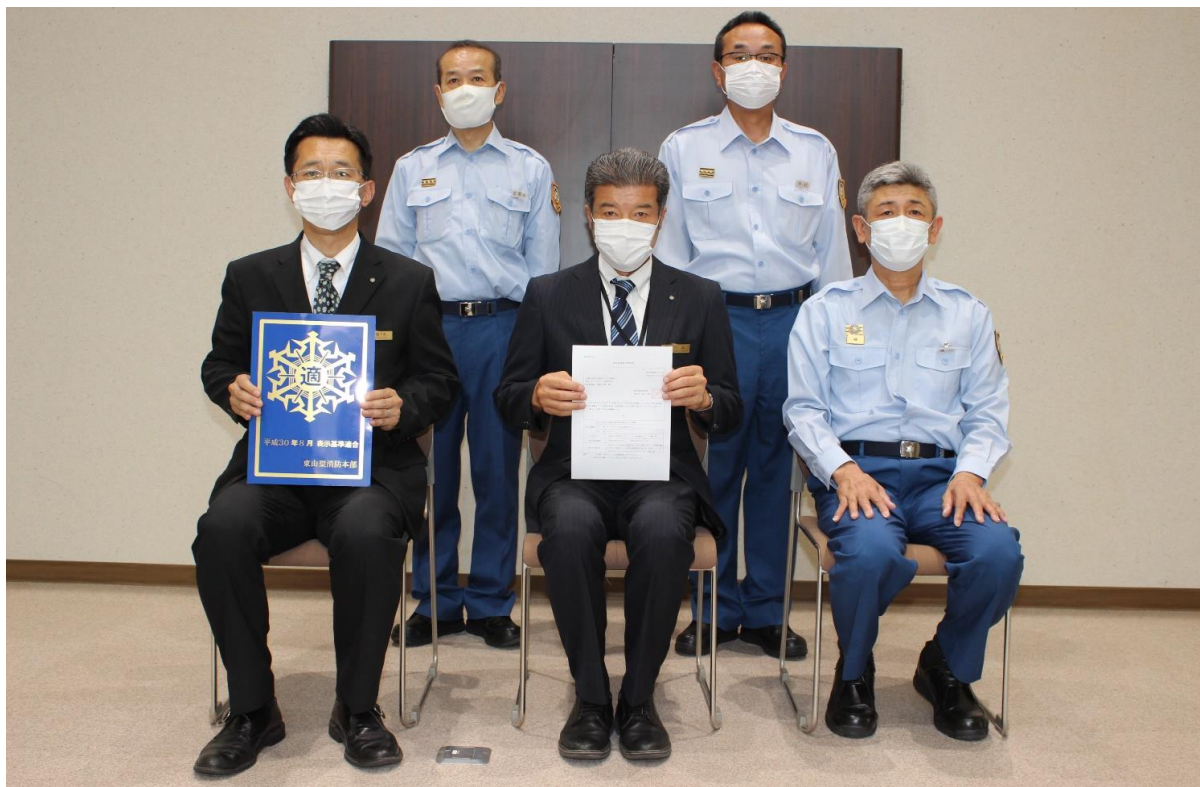
フルーツパーク富士屋ホテルへ表示マーク(金)を交付しました。