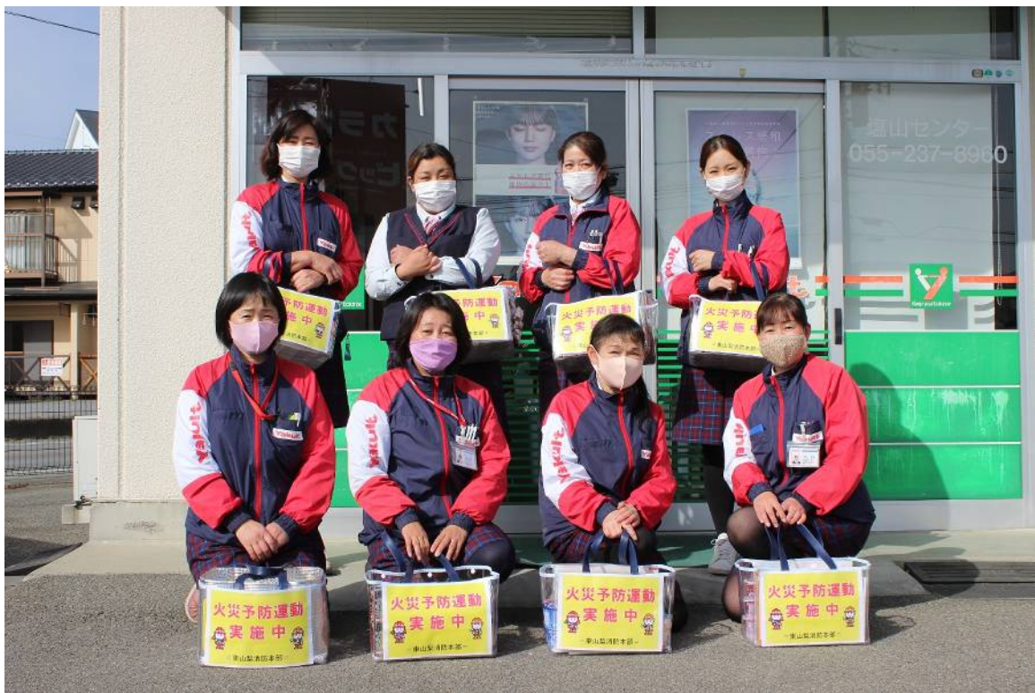
ヤクルトレディの協力による火災予防