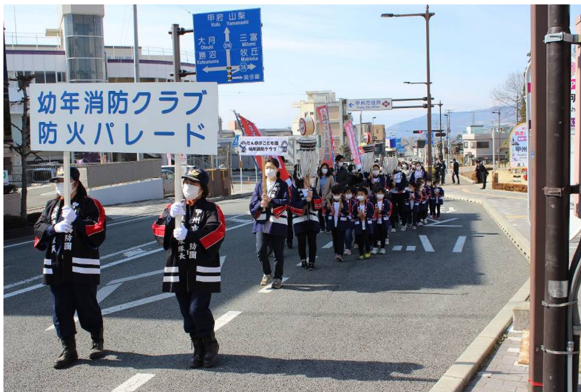
火災予防運動の一環として幼年消防クラブ員による防火パレード