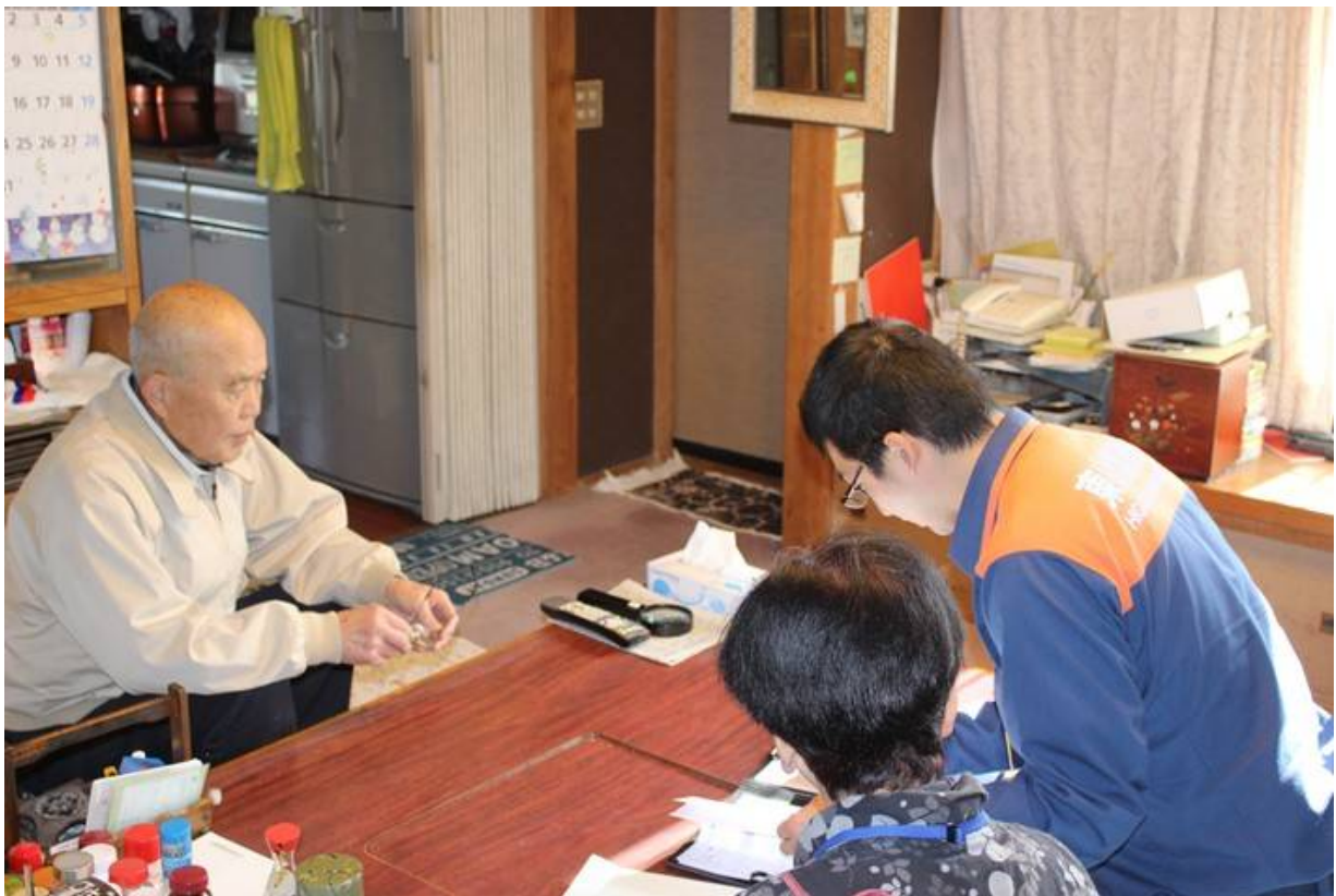
住宅防火診断の様子