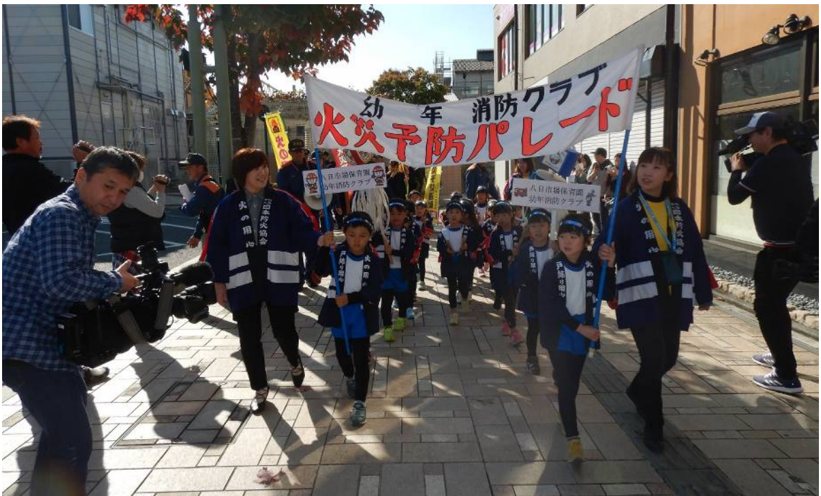
幼年消防クラブによる火災予防パレード