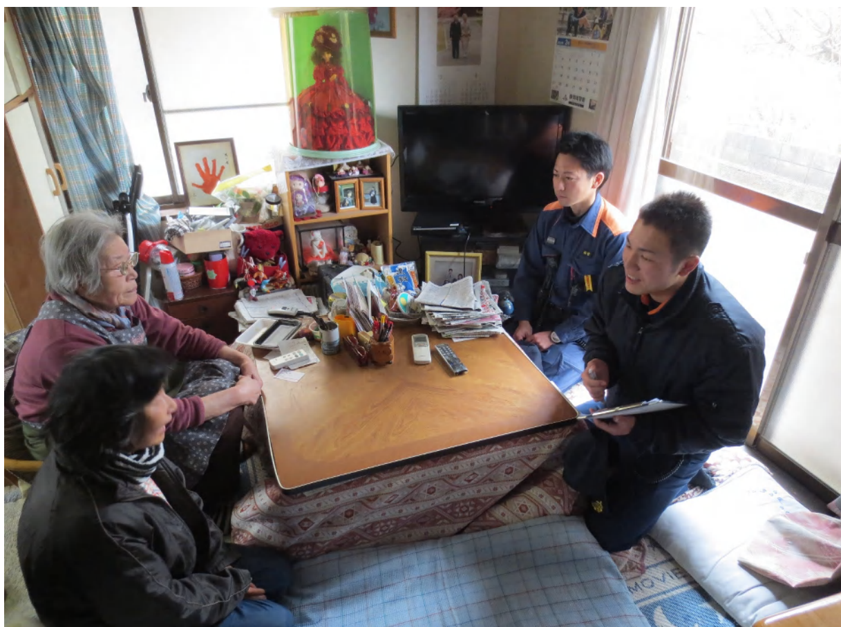
住宅防火診断の様子