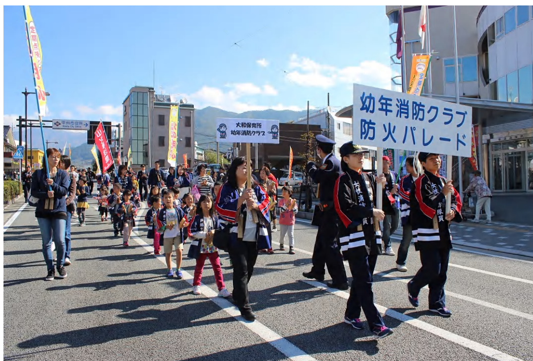
幼年消防クラブによる火災予防パレード