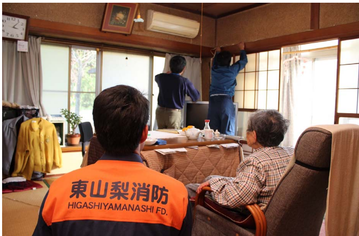
住宅防火診断の様子