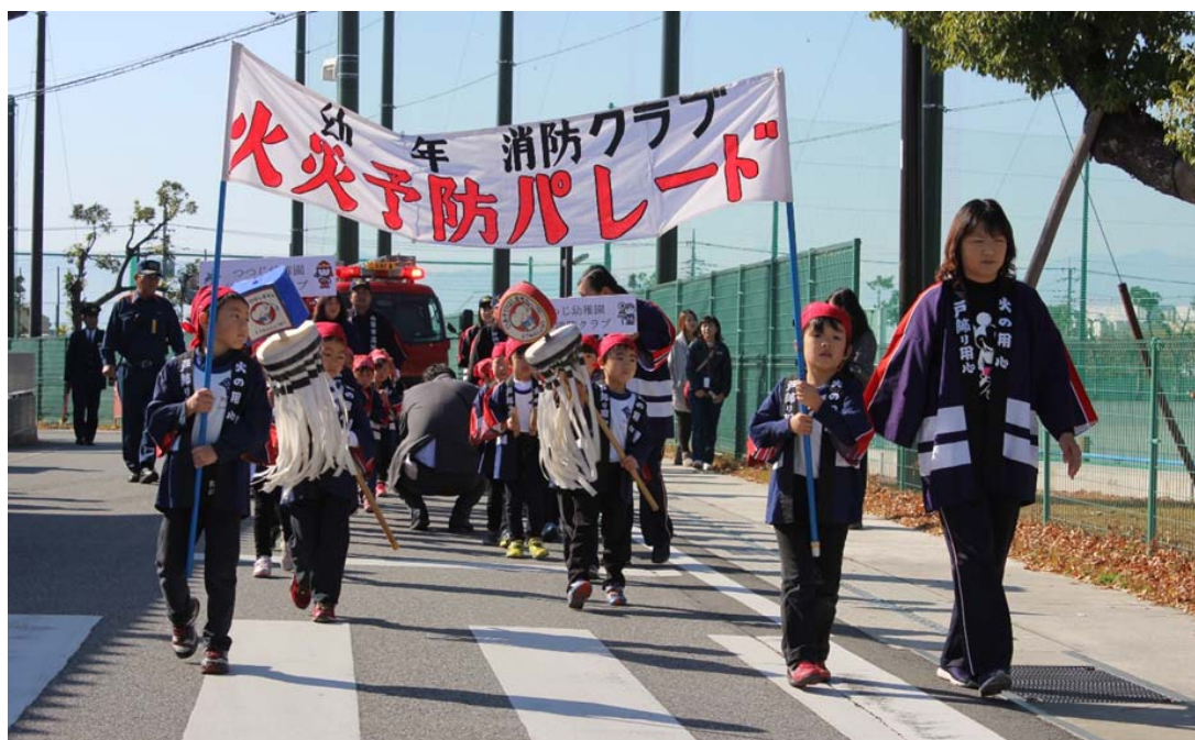
幼年消防クラブによる火災予防パレード