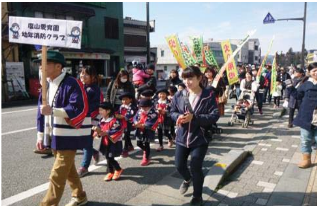
幼年消防クラブ員による火災予防パレード