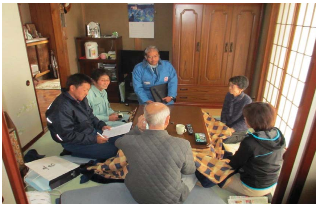
住宅防火診断の様子