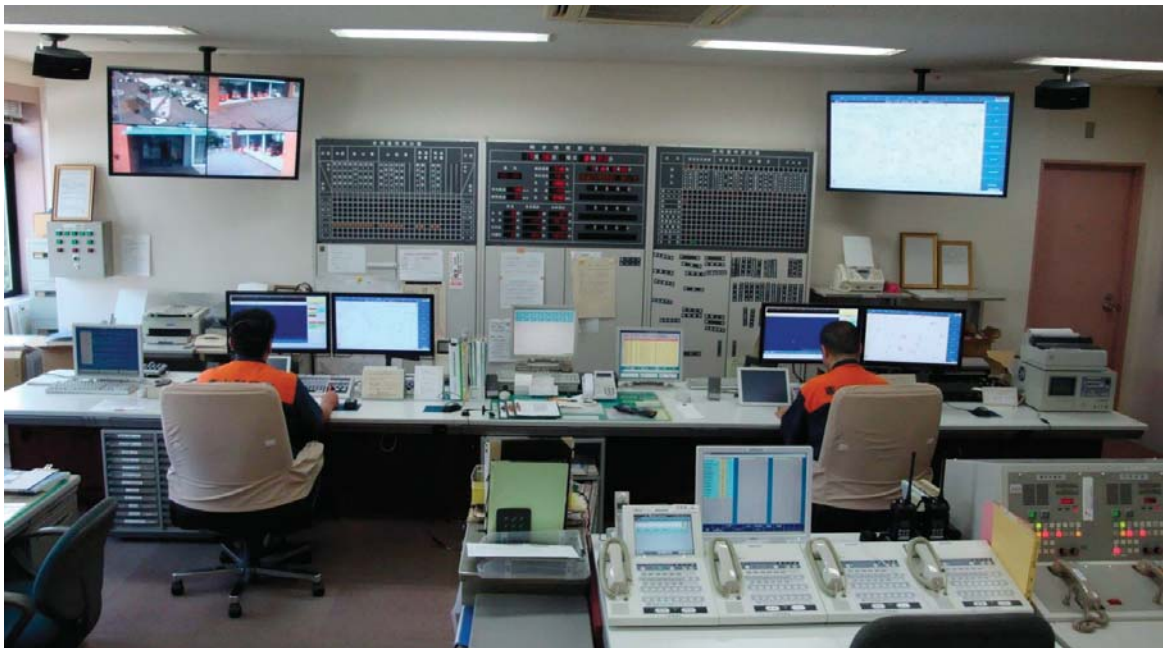
高機能消防指令システム

近年、災害は複雑多様化するとともに大規模化しており、こうした変化に即応するため、消防本部庁舎の建設と併せて近代的な通信指令施設を設置し平成10年4月13日から運用開始した。災害地点の早期確認から出場部隊編成、出場指令までの一連の作業を自動化し、災害出場の迅速化を図るとともに出場部隊の活動状況を正確に把握して適切な指令業務を行っている。平成25年4月1日からは、「消防課」から「指令課」へと所属を改め1つの課として確立し、平成26年3月に消防救急デジタル無線システム消防本部基地局が完成し、平成27年4月1日より運用開始され、日夜業務及び災害に対応しています。