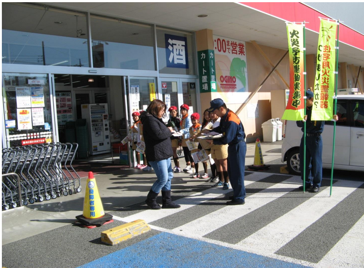
火災予防運動に伴う街頭広報