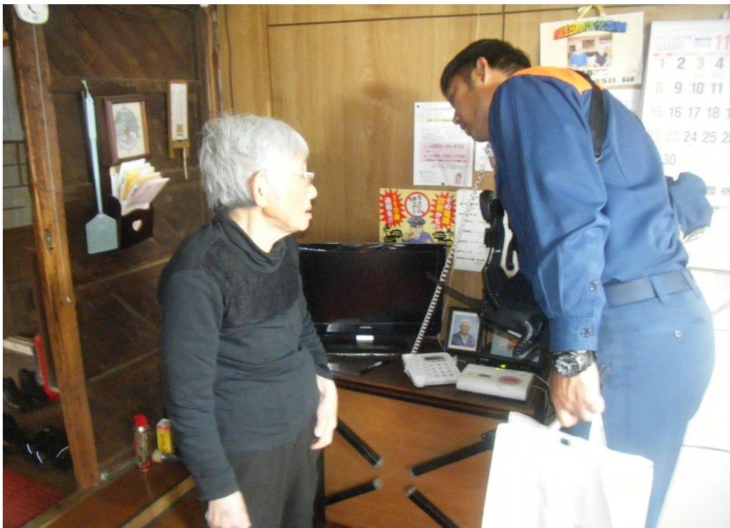
一人暮らし住宅防火診断