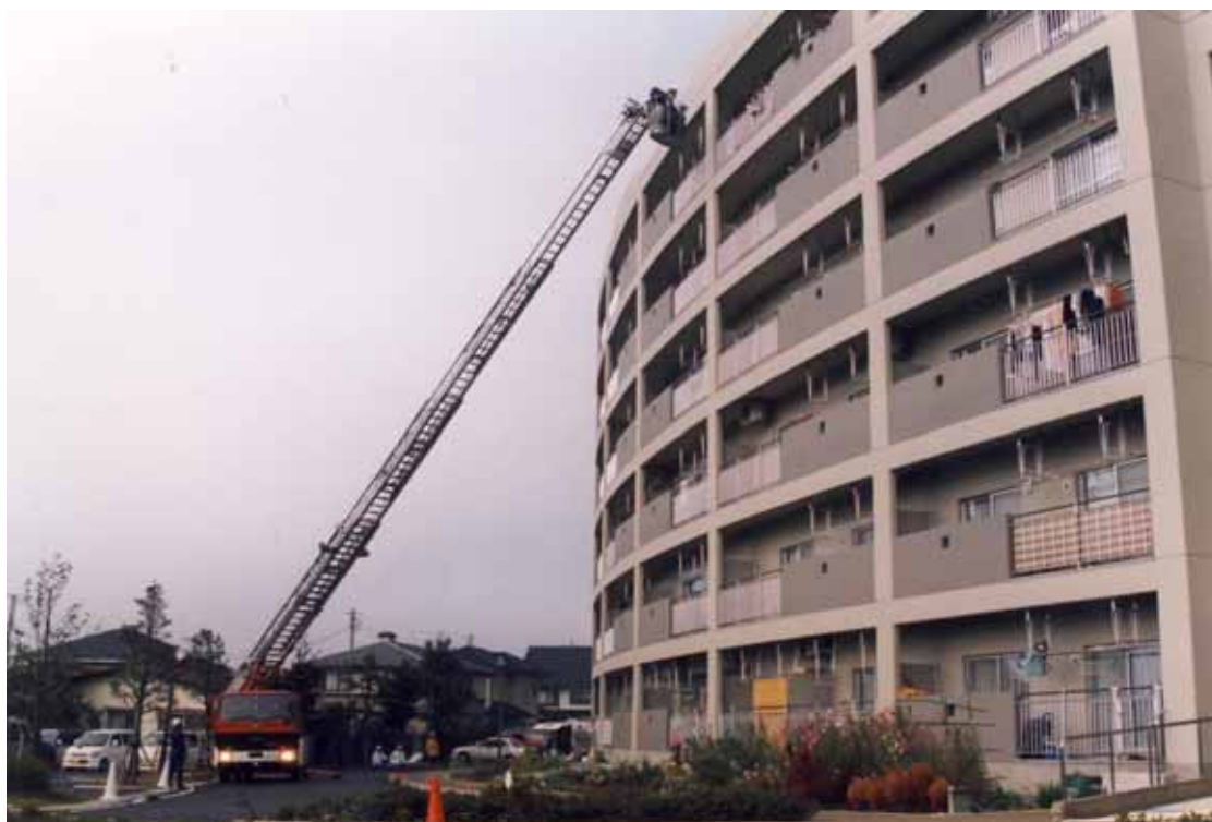
梯子車架梯訓練の様子