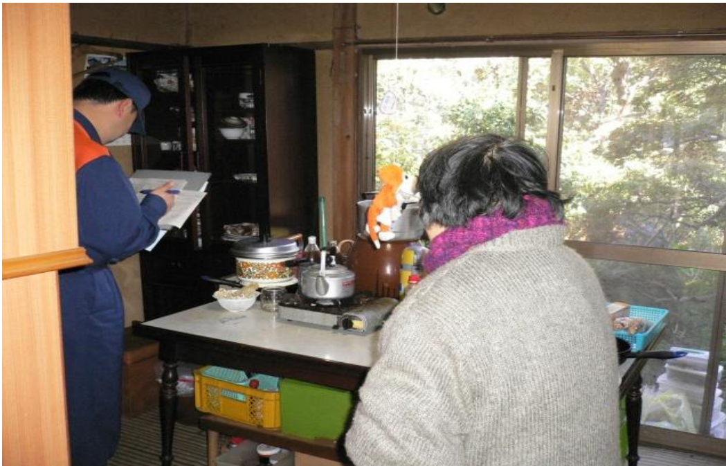
老人宅の火災予防指導の様子