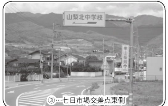
③…七日市場交差点東側