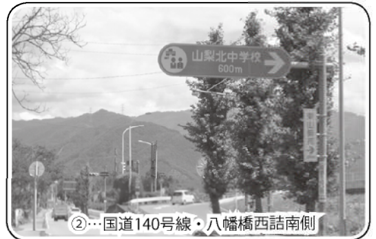
②…国道140号線・八幡橋西詰南側