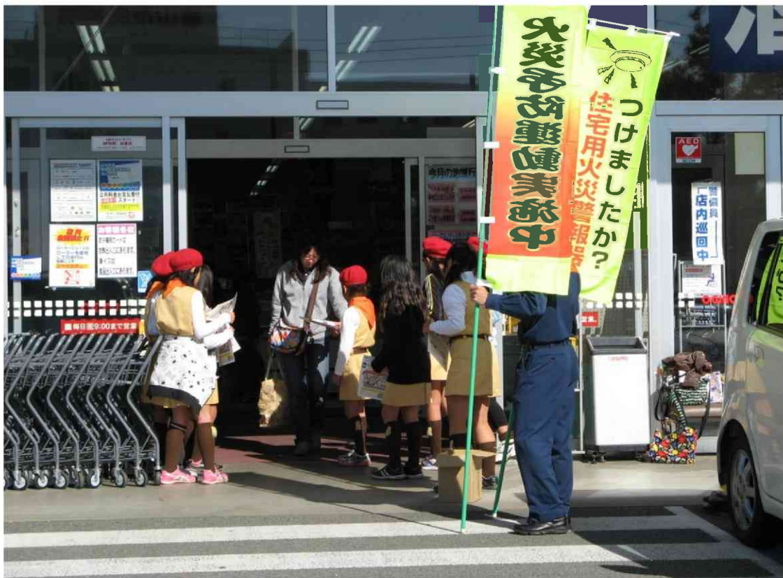
住宅用火災警報器設置推進街頭広報