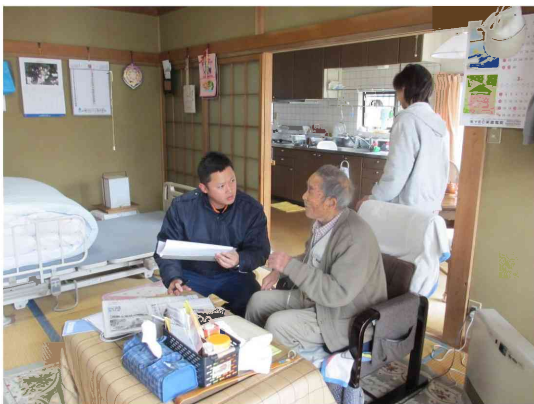
一人暮らし住宅防火診断