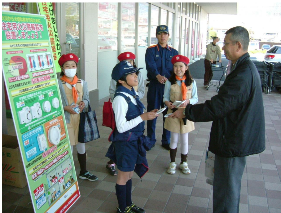
住宅用火災警報器設置推進街頭広報