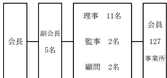
東山梨地区危険物安全協会役員構成