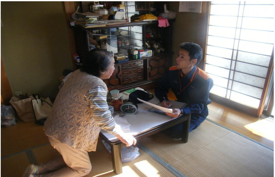
一人暮らし住宅防火診断