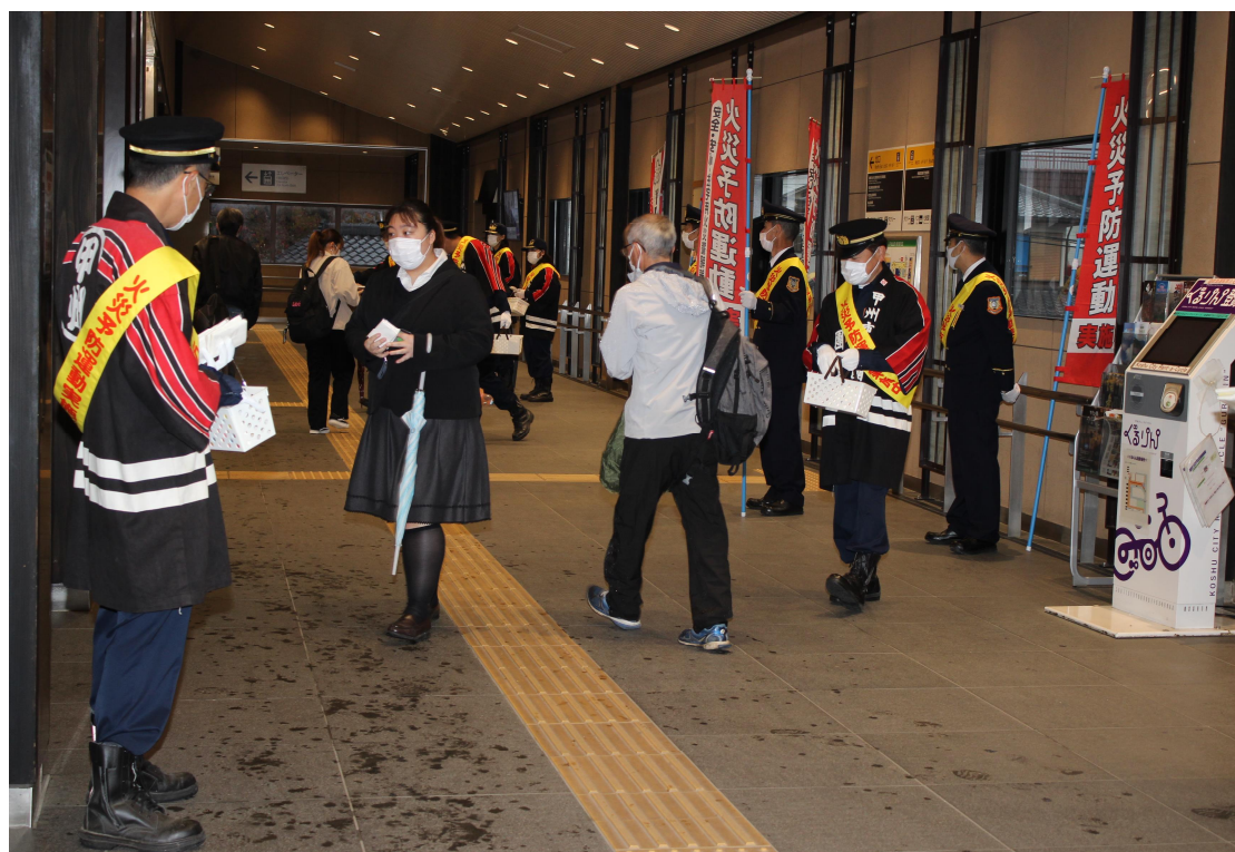
J R 塩山駅構内において、消防団との街頭広報による火災予防