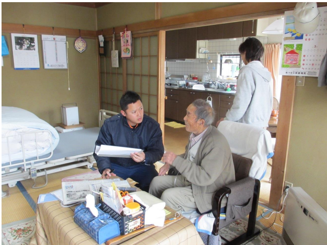
一人暮らし住宅防火診断