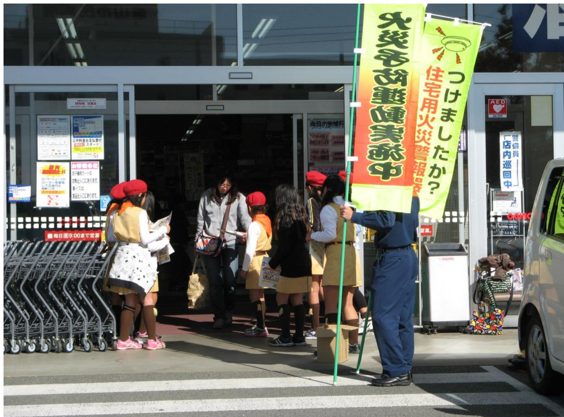
住宅用火災警報器設置推進街頭広報