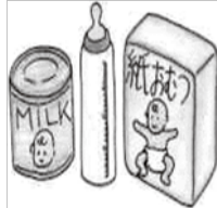
ミルク、紙おむつ (乳幼児がいる場合)