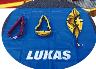
レスキューハーネス