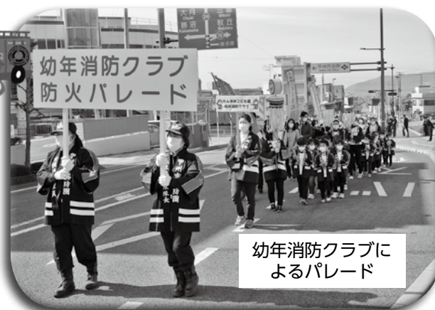
幼年消防クラブによるパレード

空気が乾燥するこの季節。 ちょっとした油断から火災は発生します。 大切なものを守るため、火の取り扱いには、 十分に注意をしてください！！